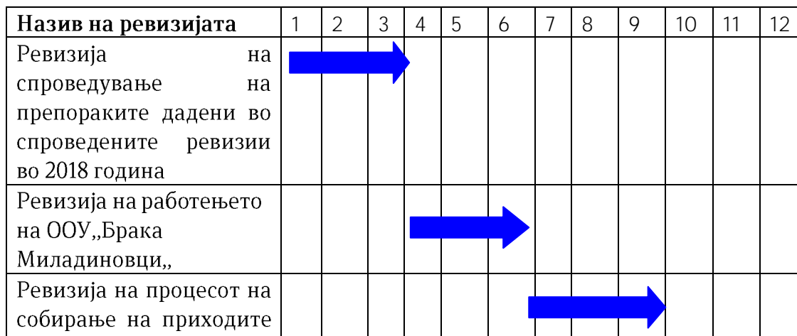
Табела 3: Годишен план на ревизијата-приказ по месеци

Планираните ревизии ќе бидат спроведени по следниот распоред: